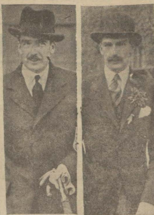
Milletler Cemiyeti Konseyinin 11 mayıs Toplantısına riyaset edecek olan İngiliz Dış Bakanı Eden'in 1923 de ve bugün çekilmiş iki resmi

(2 Teşrinievvelde söylediğim nutukta Afrika harbini bir Avrupa harbi yapma - (Devamı 11 inci sayfamızda)